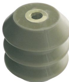
Outdoor / Externe / Buiten