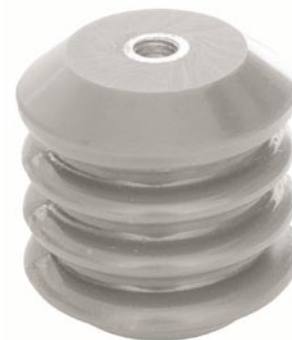
Outdoor / Externe / Buiten