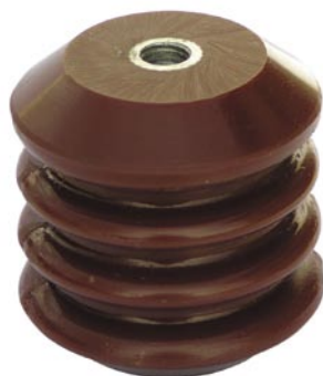
Indoor / Interne / Binnen